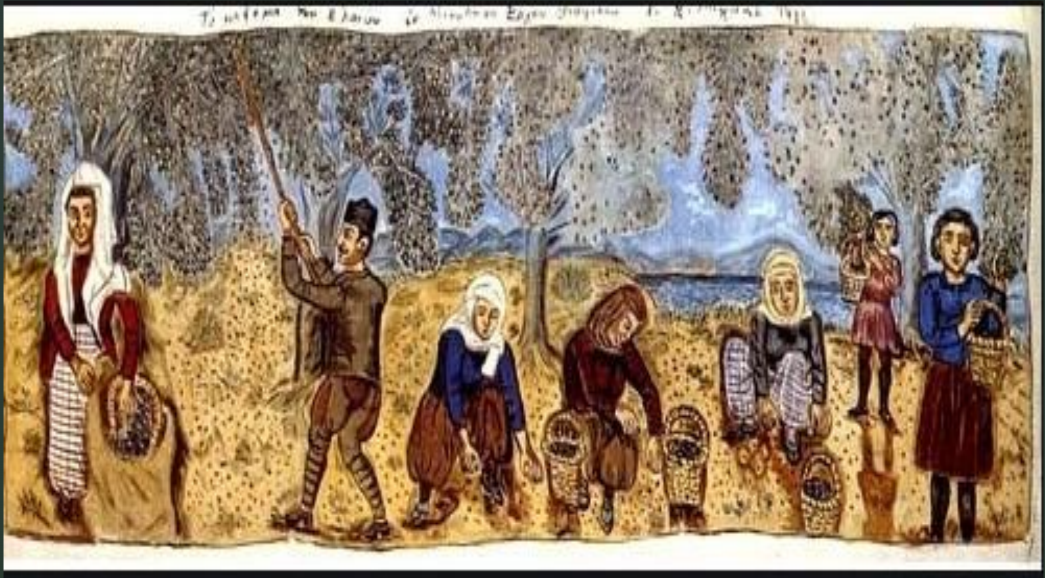
Θεόφилου Χατζημιχαήλ, “Το μάζεμα των ελαιών εν Μυτιλήνη”.