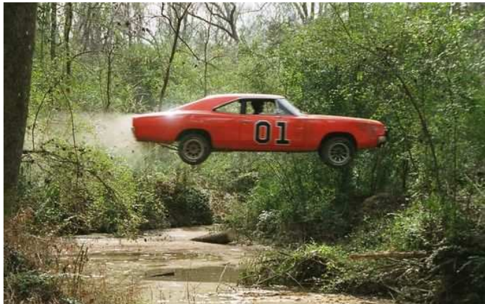
Μία από τις δεκάδες σκηνές στη σειρά «Dukes of Hazzard -1979».

β) Η απάντηση στο ερώτημα (δ) εξηγεί γιατί σε ταινίες με καταδίωξη αυτοκινήτων, βλέπουμε τα αυτοκίνητα να απογειώνονται όταν ανεβαίνουν σαμαράκια.