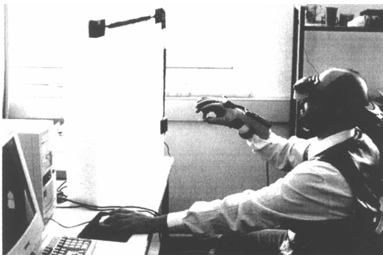
Εικόνα 1. Πλοήγηση και αλληλεπίδραση στο εικονικό εργαστήριο laser Το σχήμα 2 παρουσιάζει το εικονικό laser με το χρήστη να ρυθμίζει την ισχύ εισόδου. Το χέρι, είναι η αναπαράσταση του πραγματικού χεριού του χρήστη με το γάντι δεδομένων.

φοδοτεί με ενέργεια και μεταβάλλει τις παραμέτρους μέχρι να περάσει το κατώφλι ενέργειας που θέτει το laser εκπομπή. Ο χρήστης έχει τη δυνατότητα να δει τη δημιουργία του φωτός laser από τα λίγα αρχικά αυθόρμητα εκπεμπόμενα φωτόνια Έχει τη δυνατότητα ελέγχου της ισχύος εξόδου και του χρώματος που εκπέμπει το laser. Επιπλέον μπορεί να εισέλθει στο υλικό του laser και να μελετήσει τη σωματιδιακή φύση του φωτός, κάτι αδύνατο ακόμη και στην πραγματικότητα Ο χρήστης έχει τη δυνατότητα εμβύθισης, τρισδιάστατης όρασης και αλλαγής του οπτικού του πεδίου με κινήσεις του κεφαλιού του, με τη χρήση στερεοσκοπικών γυαλιών. Η εικόνα 1 παρουσιάζει την πλοήγηση και αλληλεπίδραση στο εικονικό εργαστήριο laser.